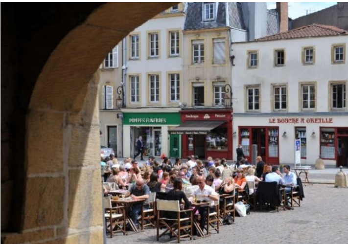
Place St. Louis