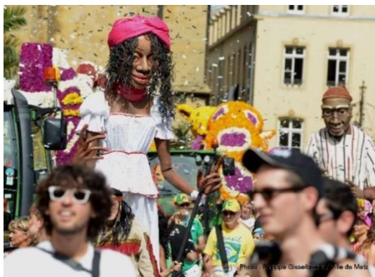
Fêtes de la Mirabelle

Weitere Infos zu Festivals und Konzerten auf: www.tourisme-metz.com und www.metz.fr