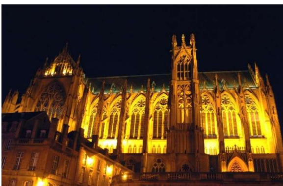
Dom St. Etienne

Metz liegt in weniger als einer Stunde Fahrt hinter der deutschen und luxemburgischen Grenze und ist daher leicht erreichbar, egal ob mit dem Auto (A4/A31), Zug (Paris 82 min., Luxemburg 55 min.), Fernbus (Flixbus, Eurolines, ...) oder Flugzeug .