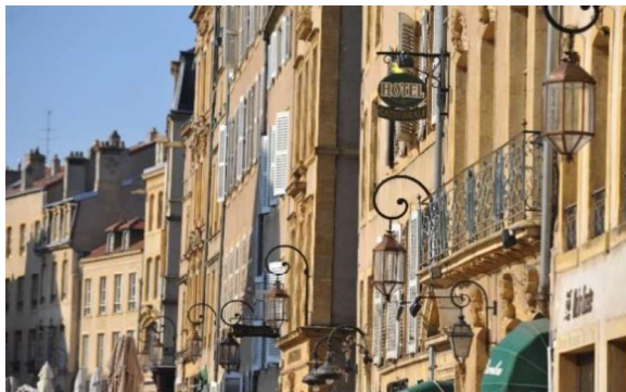
Place de Chambre

Centre Pompidou-Metz © Shigeru Ban Architects Europe et Jean de Gastines Architectes, avec Philip Gumuchdjian pour la conception du projet lauréat du concours / Metz Métropole / Centre Pompidou-Metz / Photo Roland Halbe